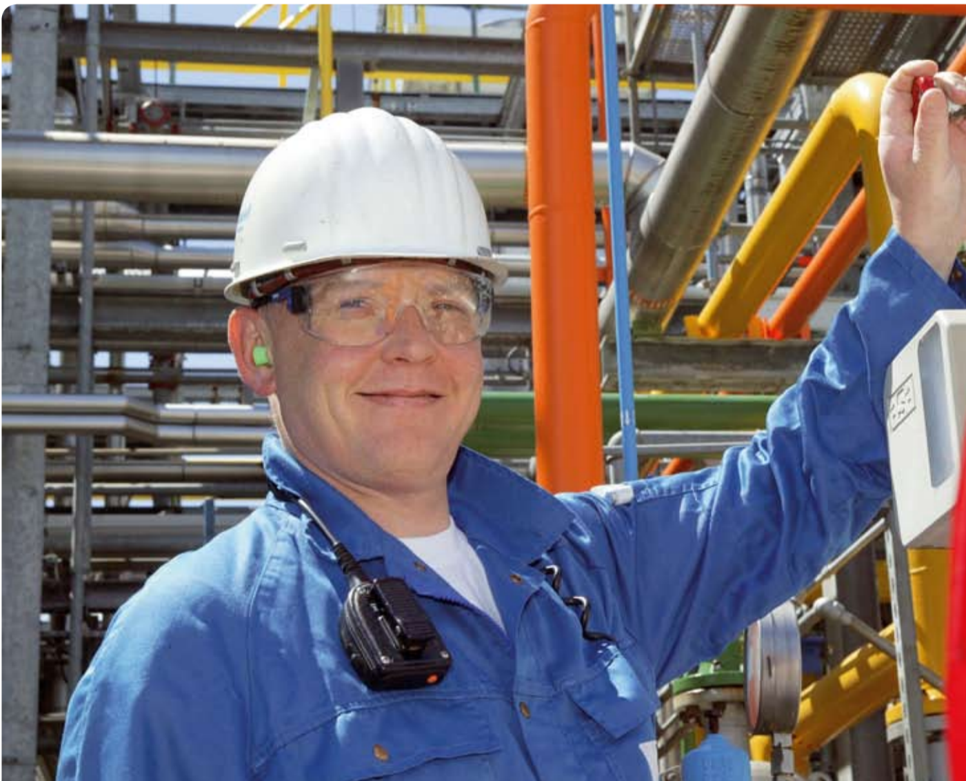
Graham Chapman "verbeteringen aanbrengen".