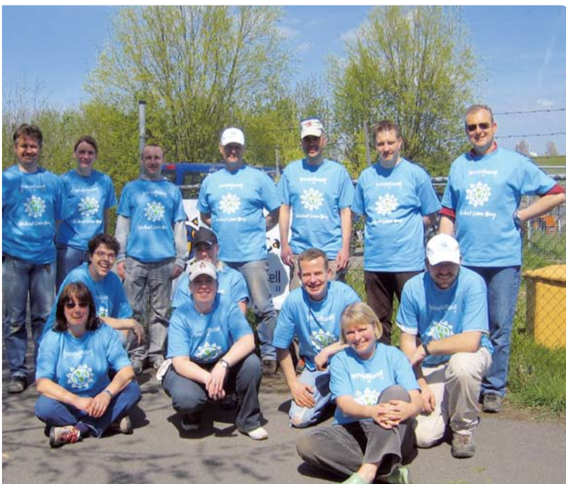
Een succesvolle eerste kennismaking met Global Care Day voor Moerdijk. Hier, samen op de foto met een aantal collega's van de lokaties Maasvlakte en Botlek en een aantal vrijwilligers van Scouting Bernisse.

Global Care Day is een initiatief dat werknemers op elke locatie van LyondellBasell uitdaagt om, alle op dezelfde dag, deel te nemen aan vrijwilligerswerk in de gemeenschap.