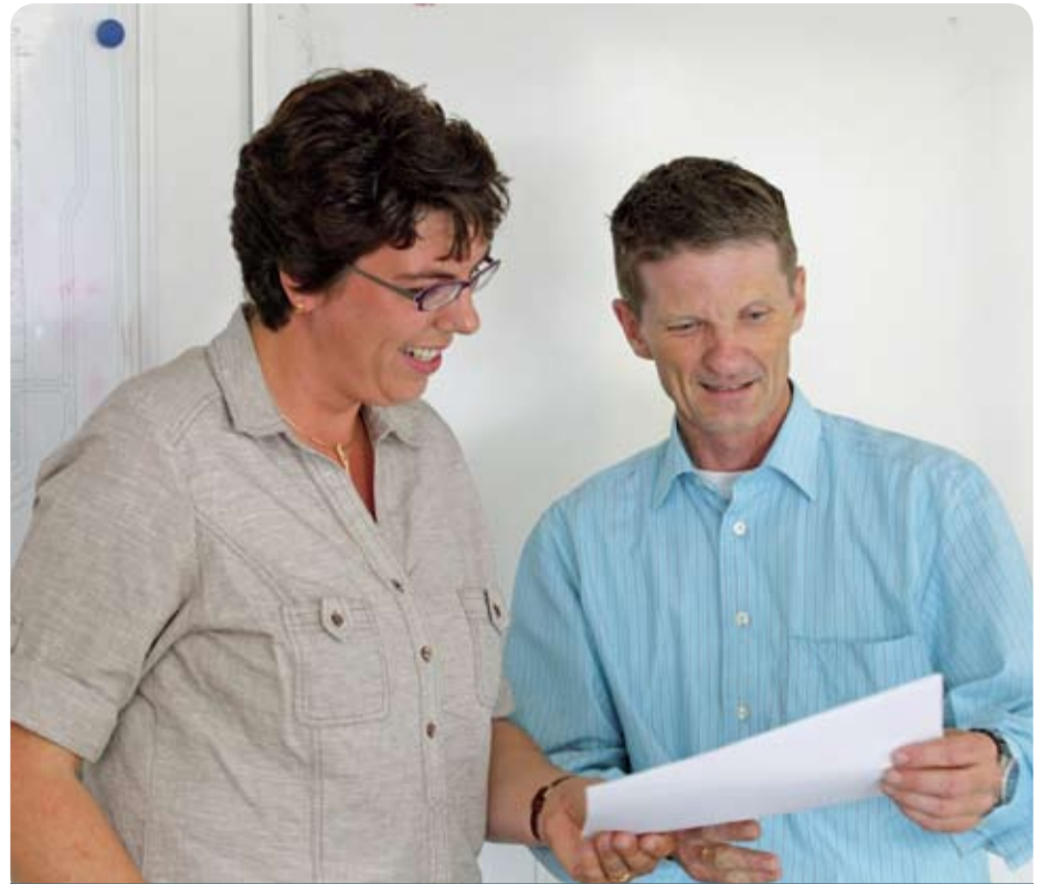
Altijd maar praten, de Site- en HR manager in overleg.

Ontwikkeling?: Er zijn meerdere manieren om je doel te bereiken, verschillen zijn niet altijd beter of slechter maar soms gewoon anders. Vanuit m'n opleiding heb ik vooral meegenomen alle communicatieve trainingen, dat betekent dus meer dan alleen praten, dat is vooral ook goed luisteren en doorvragen. Een beetje inzicht in processen en organisatie komt ook goed van pas.