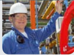
GRAHAM CHAPMAN "Maak een stuk van de fabriek zo snel mogelijk van jou" | p. 4