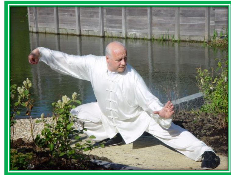
Position called Zuo Dan Bian Xia Shi