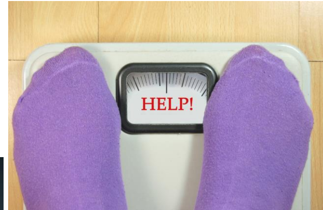
Übergewicht oder Fettleibigkeit